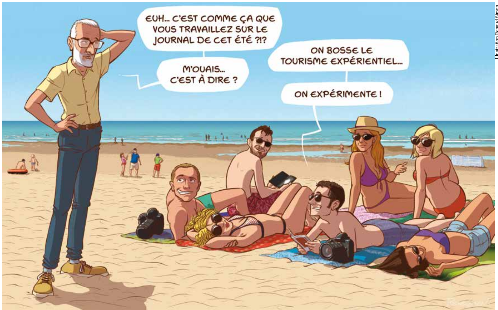
Illustration Renaud Simon

L'Écho du Pas-de-Calais a mis les petites pages – et les petites plages ! – dans les grandes pour offrir aux lecteurs un numéro estival riche en bonnes idées de balades, de découvertes. L'agenda des mois de juillet et août est copieux. L'Agence de développement et de réservation touristiques du Pas-de-Calais répète que « les expériences les plus uniques et insolites » se vivent dans le Pas-de-Calais. C'est le tourisme expérientiel pour, entre autres, « rencontrer la population locale dans les territoires, partager les savoir-faire ». Les habitants du Pas-de-Calais accueillent depuis quelques années déjà les touristes britanniques et belges, demain ils seront amenés tout au long de l'année à « ouvrir » leur gastronomie, leurs terrils, leurs plages aussi à des « voyageurs » venus des quatre coins de France. Le Pas-de-Calais a désormais la cote : lors du récent pont de l'Ascension, il s'est payé le luxe de dépasser la Gironde, le Var et l'Hérault dans les destinations choisies par les Français !