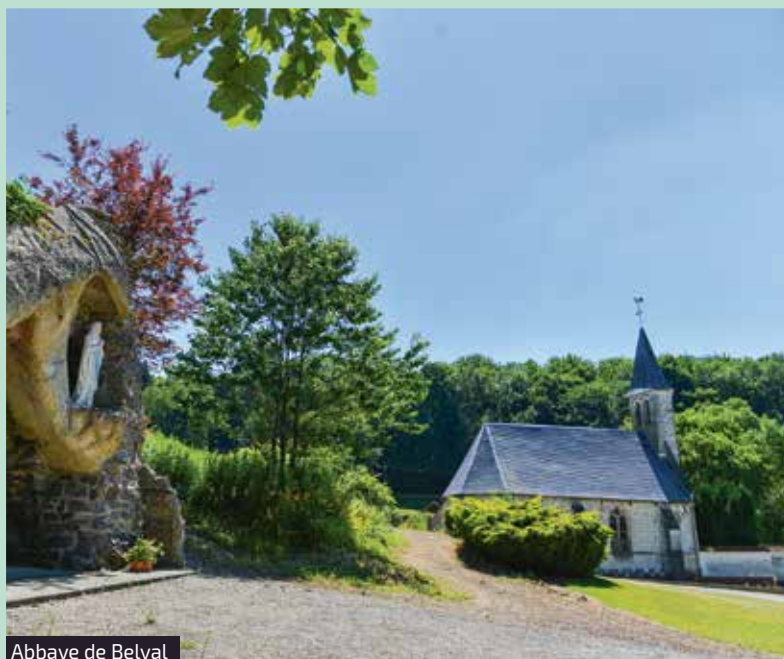
Abbaye de Belval

• 12 août, randonnée guidée à la découverte des alentours de l'abbaye de Belval où Benoît-Joseph Labre passa